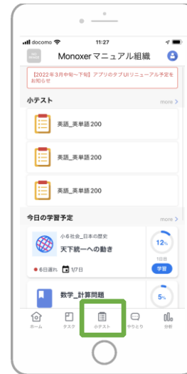
1 「小テスト」より回答したいものをタップ