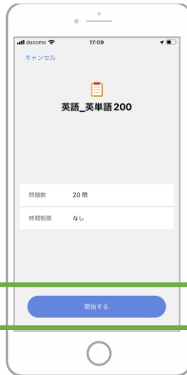
2 「開始する」をタップする