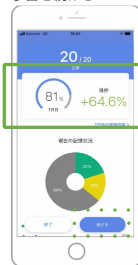
7 100%になるまで「続ける」をタップし学習を続ける