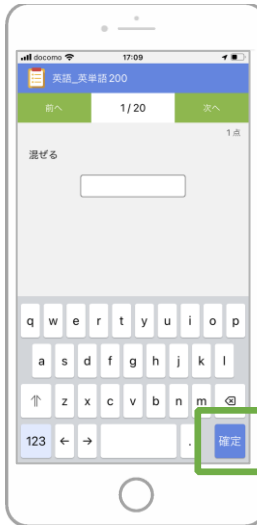
3 回答し「確定」をタップする