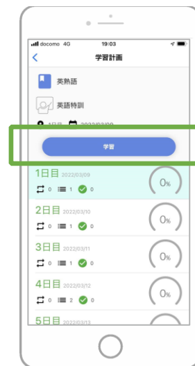
4 「学習」をタップし学習をはじめる