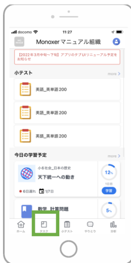
1 「タスク」をタップする