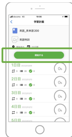
3 「開始する」をタップする